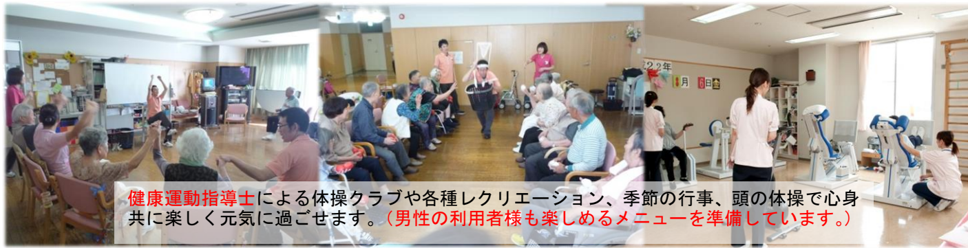
健康運動指導士による体操クラブや各種レクリエーション、季節の行事、頭の体操で心身共に楽しく元気に過ごせます。(男性の利用者様も楽しめるメニューを準備しています。)