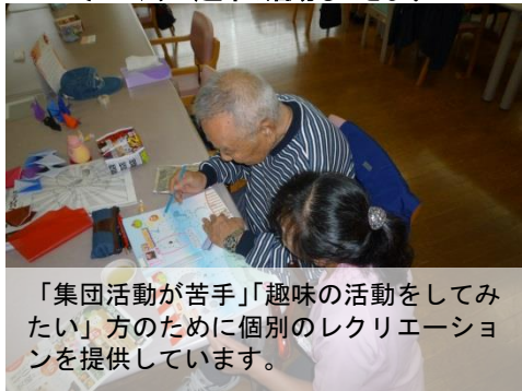
「集団活動が苦手」「趣味の活動をしてみたい」方のために個別のレクリエーションを提供しています。