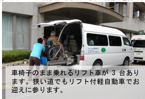
車椅子のまま乗れるリフト車が3台あります。狭い道でもリフト付軽自動車でお迎えに参ります。