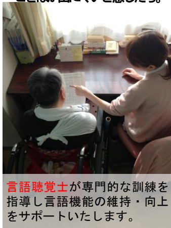
言語聴覚士が専門的な訓練を指導し言語機能の維持・向上をサポートいたします。